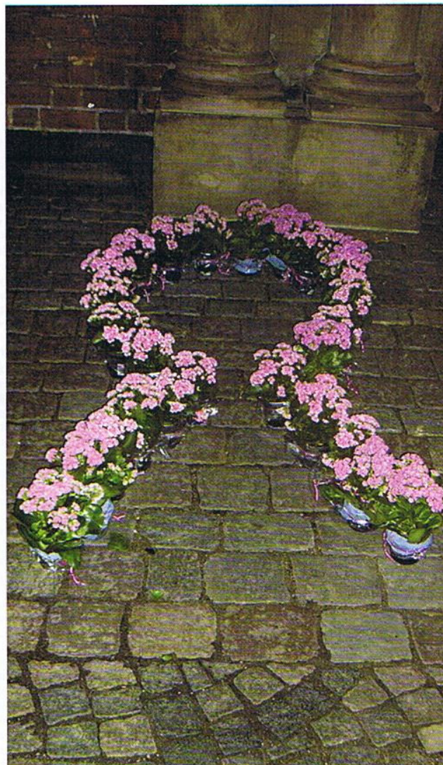
Mandag den 23. oktober 2006 var Helligåndskirken i København rammen om Patientforeningen DBO's koncert og æresprisoverrækkelse. Udenfor kirken var der pyntet op med lysrøde blomster, som dannede to store sløjfer. En stemningsfuld start på en fantastisk aften.

Udgivelse: Patientforeningen DBO og Brystkræftgruppen med støtte fra Kræftens Bekæmpelse Oplag: 2800 Redaktion: Karen Veien og Dorte Hansen Layout: Dorte Hansen